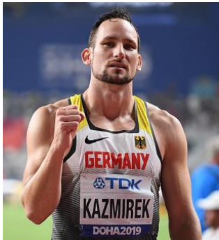
© Gladys Chai von der Laage

Kai Kazmirek ( Zehnkampf ; Bronze Weltmeisterschaften 2017, U23-Europameister 2013, Bronze Junioreuropameisterschaften 2009)