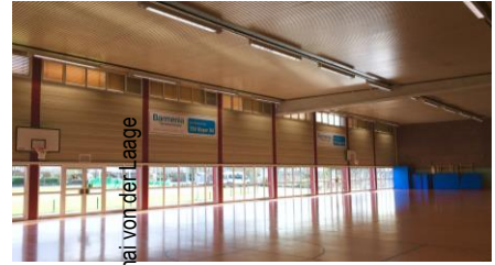
© Gladys Chai von der Laage