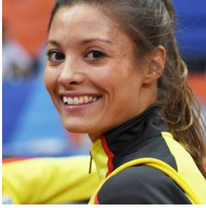
© Gladys Chai von der Laage

Ruth Sophia Spelmeyer-Preuß (400m, 4x400m; Halbfinale OS 2016, Halbfinale WM 2017, 6. Platz WM 2017 4x400m)