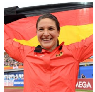
© Gladys Chai von der Laage

Linda Stahl ( Speerwurf ; Bronze Olympische Spiele 2012, Europameisterin 2010, Vize-Europameisterin 2016, Bronze Europameisterschaften 2014/2012)