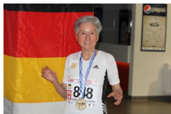
Goldmedaillengewinnerin Melitta Czerwenka-Nagel mit neuer deutscher Bestleistung im 3.000 m Lauf

Erfolgreicher lief es bei der Saarländerin Melitta Czerwenka-Nagel, die ihre nationale Bestleistung auf 17:13,84 min. drückte und sich den Sieg in der W80 sicherte.