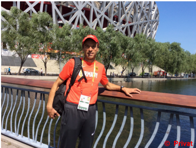
Vor dem „Vogelnešt“ in Peking zur WM 2015