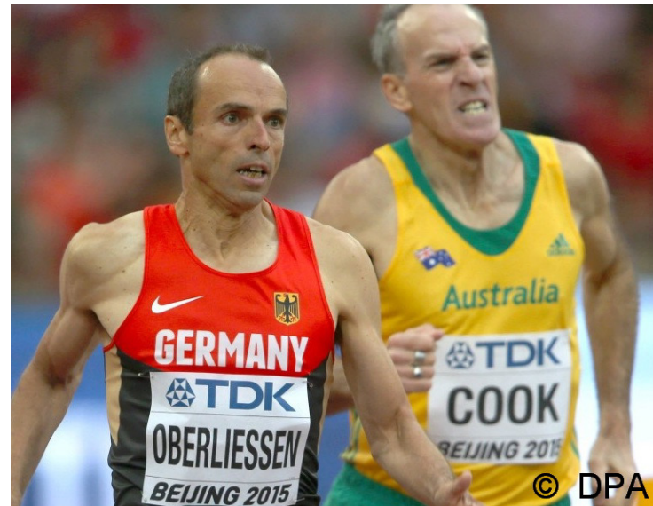
Masters Einlagelauf über 800m bei der WM 2015 in Peking